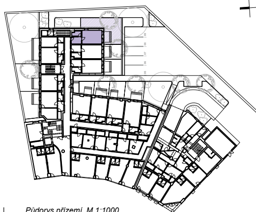
Půdorys přízemí, M 1:1000