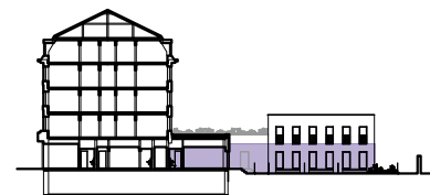
Řezo-pohled, M 1:1000

Plochy místností jsou pouze orientační. Zařízení a vybavení jednotky v plánu jako nábytek, kuchyňská linka, vestavné skříně a domácí spotřebiče nejsou předmětem dodávky. Rozsah dodávky je specifikován ve standardu. Investor si vyhrazuje právo na drobné úpravy.