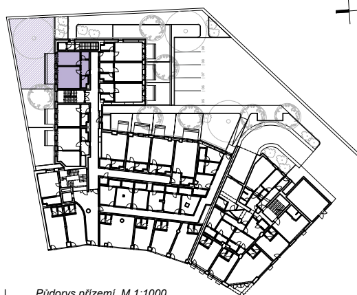
Půdorys přízemí, M 1:1000