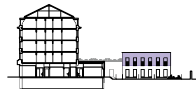
Řezo-pohled, M 1:1000

Plochy místností jsou pouze orientační. Zařízení a vybavení jednotky v plánu jako nábytek, kuchyňská linka, vestavné skříně a domácí spotřebiče nejsou předmětem dodávky. Rozsah dodávky je specifikován ve standardu. Investor si vyhrazuje právo na drobné úpravy.